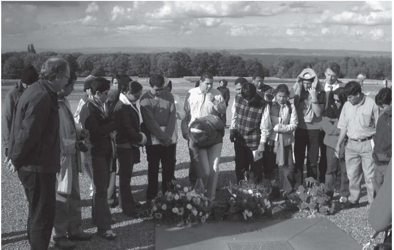
Gedenken an die Opfer des Holocaust. Teilnehmende des Grundkurses in der Gedenkstätte KZ Buchenwald.

Jede/r Teilnehmer/in am Grundkurs in Berlin hat dort sein/ihr Transferprojekt konzipiert, ein halbes Jahr später am Vertiefungskurs in der Region, und wiederum fünf Monate später an einem Workshop im Herkunftsland teilgenommen, und im Regelfall das Transferprojekt durchgeführt. Dieser Prozess zieht sich über einen Zeitraum von einem Jahr hin. Schließlich haben fast alle Teilnehmenden der ersten Projektphase an einem gemeinsamen Treffen in Guatemala teilgenommen, was ihnen über die Möglichkeit des Kennenlernens hinaus die Gelegenheit zum fachlichen Austausch gab. Flankiert wird dieser Weiterbildungszyklus durch die Möglichkeit, über die InWEnt-Lernplattform Global Campus fachlich beraten zu werden und sich dort mit anderen auszutauschen. Schließlich hat sich eine Gruppe von Teilnehmenden an einem gemeinsamen schriftlichen Reflexionsprozess über das Projekt beteiligt, der in 2007 publiziert werden wird. Diese Lernarchitektur macht deutlich, dass Lernen nicht als punktueller, einmaliger Moment begriffen wird.