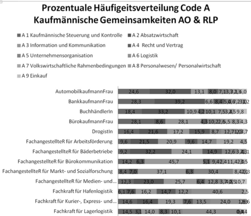
Abbildung 3: Prozentuale Häufigkeitsverteilung der kaufmännischen Gemeinsamkeiten auf ausgewählte Ausbildungsberufe