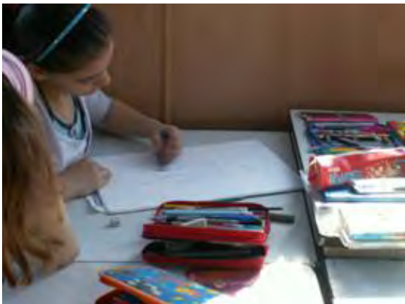
Abb. 1 Gruppenarbeit