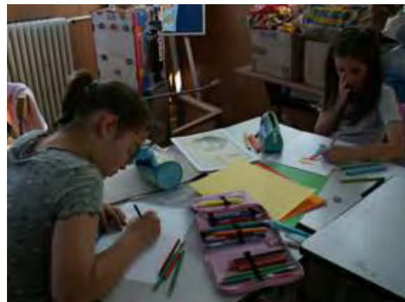
Abb. 2 Gruppenarbeit

Danach wurden die Zeichnungen ausgehängt und Gemeinsamkeiten gefunden. Und weil der Schal ein Detail war, der in allen Zeichnungen vorkam, entschieden wir uns, dass unser kleiner Prinz auf jeden Fall einen langen Schal tragen müsste. Danach erfolgte eine mündliche Charakterisierung des kleinen Prinzen. Die Kinder durften ihre eigene Meinung zu dem Prinzen sagen: was ihnen an ihm gefallen hat, was nicht, in welchen Punkten haben sie sich mit dieser Gestalt identifizieren können, in welchen eher nicht.