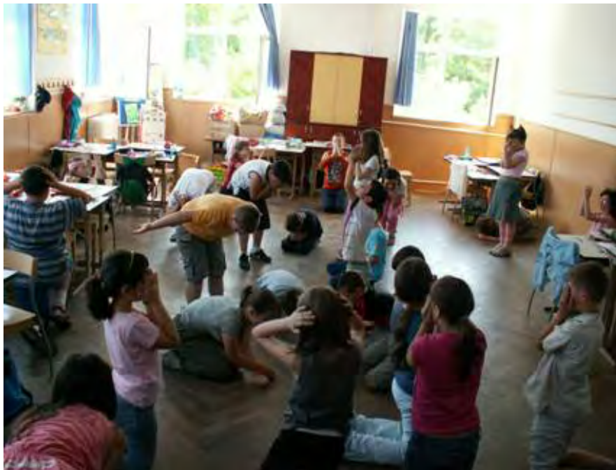
Abb. 10 Rosentanz

Nach diesem intensiven Körpertraining folgten die Gruppeneinteilung und die Aufgabenstellungen. Da es sieben Planeten sind, die der kleine Prinz besucht, sollten sich die SchülerInnen in sieben Gruppen einteilen, die aus je vier Schüler bestanden. Jede Gruppe sollte nun zusammen das eigene Kapitel lesen und sich für ein paar Stichwörter entscheiden; damit sollten sie danach einen kurzen Dialog (zwischen 6 und 8 Replikenpaare) schreiben. Zu meinem Erstaunen sind die Dialoge sehr gut geworden. Außerdem sollten sie den Bewohner des Planeten zeichnen und auch überlegen, was für Requisiten notwendig wären.