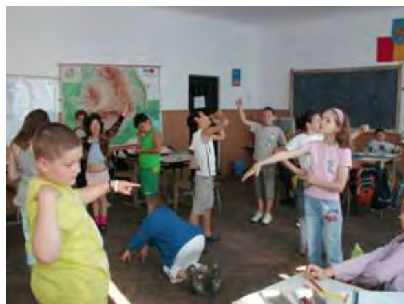
Abb. 7 Bildhauer betrachten ihre Statuen

Danach durften die Kinder über ihre Erlebnisse im Theater berichten: ob sie jemals im Theater waren, welches Theaterstück sie gesehen haben und ob es ihnen gefallen hat oder nicht und begründen. Wir erklärten gemeinsam Termini wie Schauspieler, Haupt-