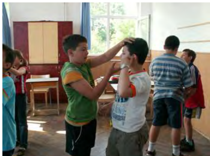
Abb. 4 Bildhauer formen Statuen