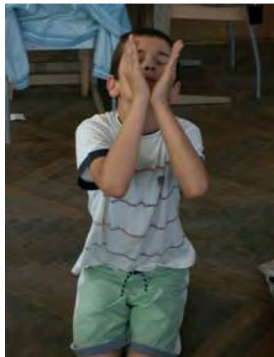
Abb. 9 Rosentanz