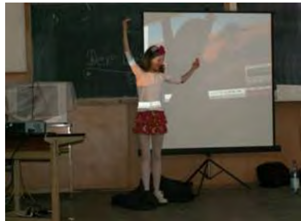
Abb.15 Die Rose des kleinen Prinzen