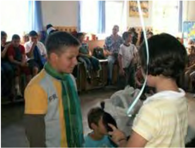
Abb. 12 Kleiner Prinz und Fuchs

Der Tag endete mit einer „Klopfmassage“. Die Kinder waren müde, aber glücklich, denn es schien, dass alles wunderbar klappte.