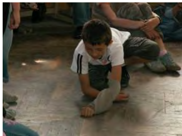
Abb.19 Die Schlange