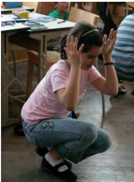
Abb. 8 Rosentanz

Eine andere Figur, die im „Kleinen Prinzen“ vorkommt und eine wichtige Rolle spielt, ist die Rose. Die Kinder gingen durch den Raum. Bei einem Impuls blieben sie stehen und verkörperten die Rose. Als Anschluss wurde dann die Rolle der Rose besprochen. Die Kinder wiesen darauf hin, dass der kleine Prinz eine Rose auf seinem Planeten hat, aber auf der Erde gibt es viele Rosen. Und so versuchten sie verschiedene Rosen darzustellen: kleine und große. Die wichtigste Eigenschaft aber ist der Stolz, alle Kinder waren sich einig, dass alle Rosen stolz sind. Nun machte ich die Kinder mit den slow-motion -Bewegungen bekannt, indem wir auf einem langsamen Lied das Erwachen der Rose darstellten. Wichtig dabei war es, dass die Bewegungen ganz langsam durchgeführt werden mussten. Der Tanz hatte einen so großen Erfolg, dass wir uns gemeinsam entschieden, dass alle Kinder die Rosen auf der Erde darstellen sollten. Und weil jeder „seiner“ Rose doch die eigene Persönlichkeit geben wollte, nahmen sie sich vor, verschiedenfarbige Mützen aufzusetzen.