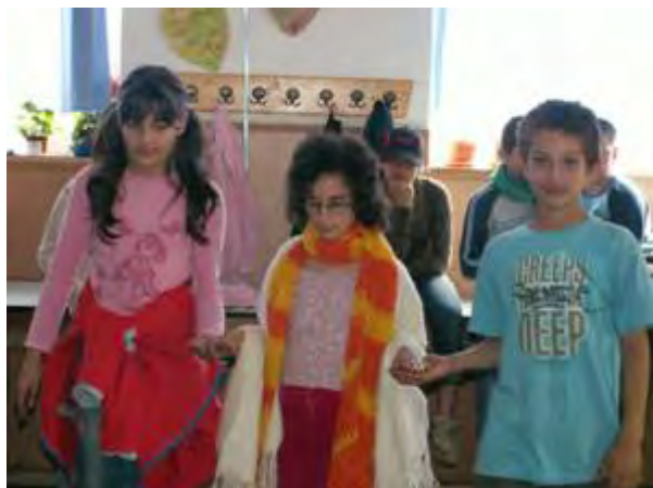
Abb.17 Der kleine Prinz und die beiden Vögel

Nachdem die Gäste weggegangen waren, folgte eine kurze Reflexion der ganzen Projektwoche. Alle Arbeitsphasen wurden noch mal erwähnt und ausgewertet. Die meisten Kinder waren einverstanden, dass auch in der 5. Klasse ein Theaterprojekt stattfinden sollte.