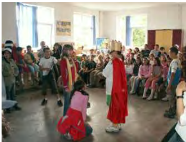
Abb.16 Der kleine Prinz und der König Vögel