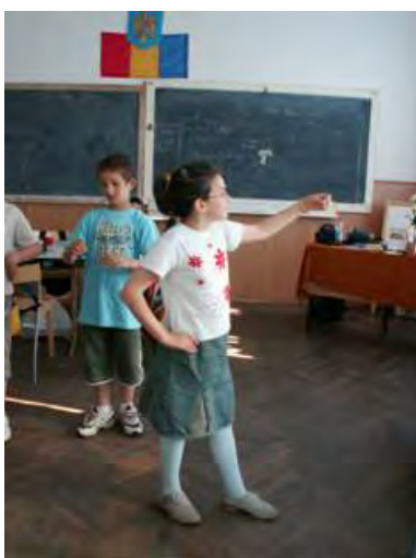
Abb. 6 Bildhauer betrachten ihre Statuen

Am Ende der Übungen erfolgte eine kurze Reflexion, damit sich die SchülerInnen bewusst wurden, was sie erlebt hatten und wie sie das empfunden hatten. Es ist wichtig, dass die Kinder über ihre körperlichen und emotionalen Erlebnisse sprechen, denn die Reflexion ist ein wichtiger Bestandteil der Theaterarbeit. Sie erzählten, wie sie die Rollen des aktiven Bildhauers und des passiven Lehms erlebten.