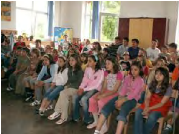
Abb.14 Die Zuschauer