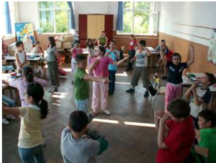
Abb. 5 Bildhauer betrachten ihre Statuen

Die Übung gefiel den Kindern so gut, dass wir uns entschieden, sie für unsere Aufführung zu verwenden: u. zw. sollten die Bewohner der sieben Planeten von sieben Bildhauer geformt werden