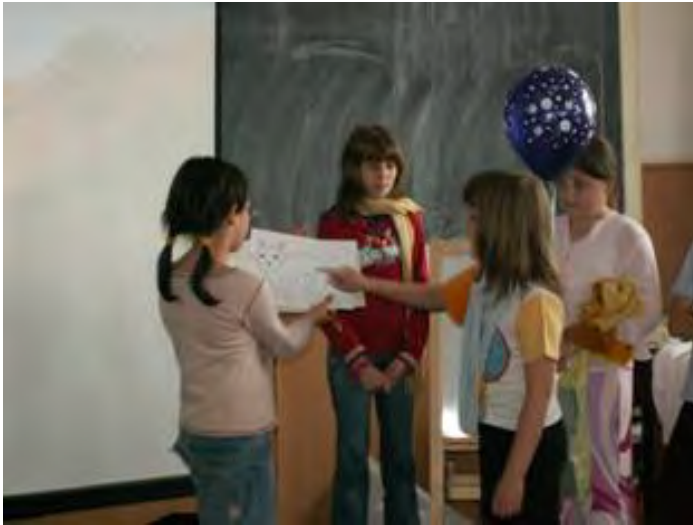
Abb.13 Prinz und Erzähler (mit Zeichnungen)