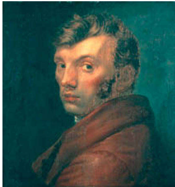
Abb. 3: Selbstbildnis im braunen Rock 1810

© bpk / Kunsthalle Hamburg Kunsthalle Hamburg