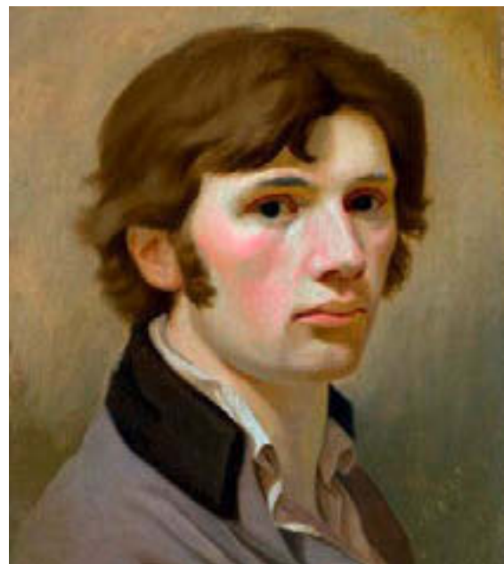
© bpk / Kunsthalle Hamburg Kunsthalle Hamburg

Das „Selbstbildnis mit braunem Kragen“ (1802) zeigt den Maler als eine Person, die vor den/die BetrachterIn tritt. Wir sehen im Halbprofil im Brustbild einen weichen jungen Mann, der uns fragend und offen anschaut. Das durch die dunklen Haare gerahmte Gesicht tritt vor einen hellen, grau-grün-bräunlichen Hintergrund und auf uns zu. Die Kontur ist weich, teilweise durch farbige Übergänge einzelner Pinselstriche in den Kontext aufgelöst. Wir sehen eine zurückgenommen fragende Erwartung. Durch den kleinen Bildausschnitt wird das durchgebildete Gesicht plastisch und stofflich hervorgehoben und das Gesicht erhält hohe sinnliche Präsenz als Zugang zur Seele. Die dunklen Augen werden zu Eingängen