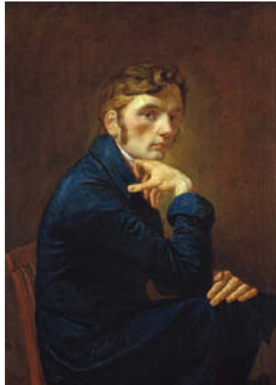
Abb. 2: Selbstbildnis im blauen Rock 1805

© bpk / Kunsthalle Hamburg Kunsthalle Hamburg