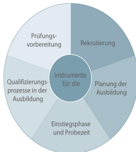
Abb. 1: Qualitätsrelevante Phasen der Ausbildung (eigene Darstellung)

Dazu soll gemeinsam mit Handwerksbetrieben im Kammerbezirk Hannover, der Handwerkskammer Hannover und der ZWH für die qualitätsrelevanten Phasen der Ausbildung konkrete Instrumente zur Qualitätssicherung und -entwicklung erarbeitet und erprobt werden. Aufgrund der Vorerfahrungen der Verbundpartner in der beruflichen Erstausbildung wurden für das Projekt fünf für die Ausbildungsqualität besonders wichtige Phasen definiert: 1. Rekrutierung, 2. Planung der Ausbildung, 3. Einstiegsphase und Probezeit, 4. Qualifizierungsprozesse in der Ausbildung und 5. Prüfungsvorbereitung (siehe Abbildung 1):