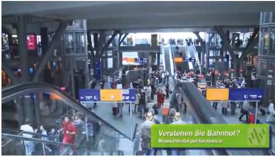
Abb. 2: Sounding D