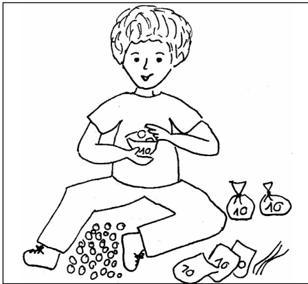
Abb. 4: Bündeln von 10er Mengen

Das mathematische Ergebnis wird im nächsten Schritt dann formalisiert, d.h. mit den konventionellen mathematischen Zeichen und Begriffen notiert sowie interpretiert: Unabhängig davon, wie die Murmeln gezählt werden, erhält man die Gesamtzahl von 86.