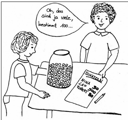
Abb. 2: Alltagssituation – Murmeln schätzen

In diesem Fall bietet sich die 10er Bündelung als effektive Möglichkeit an (Abb. 4). In dieser Alltagssituation lassen sich zahlreiche Handlungen sowie deren Abstraktionen auf vielfältige und unterschiedliche Weise umsetzen.