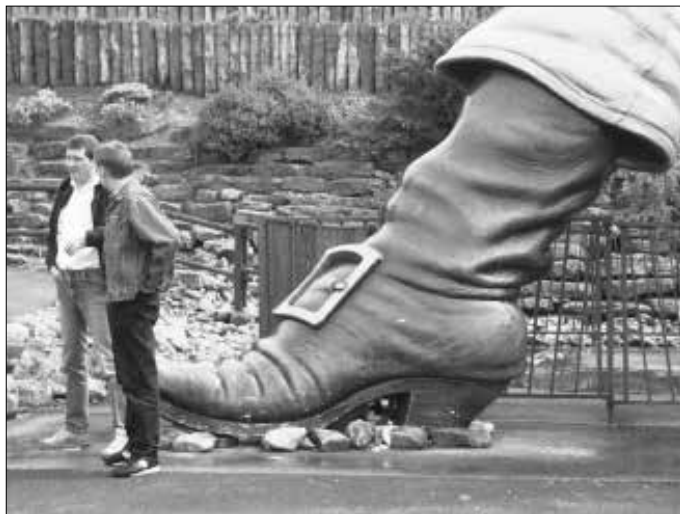
Document 1: photographie remise aux enseignants

Notre groupe de recherche a fourni un même problème à six professeurs des écoles de Cours Moyen 2 e année (enfants de 10 ans). Il s'agit d'une photographie 3 accompagnée de l'énoncé suivant: «Cette photo a été prise dans un parc d'attractions en Angleterre. On y aperçoit une partie de la jambe d'un géant. Quelle est la taille de ce géant?» (Document 1).