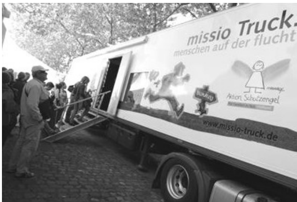
Abb. 1: Besucher vorm missio-Truck „Menschen auf der Flucht“; Quelle: missio

Keywords: missio, missio-Truck, escape, Aktion Schutzengel