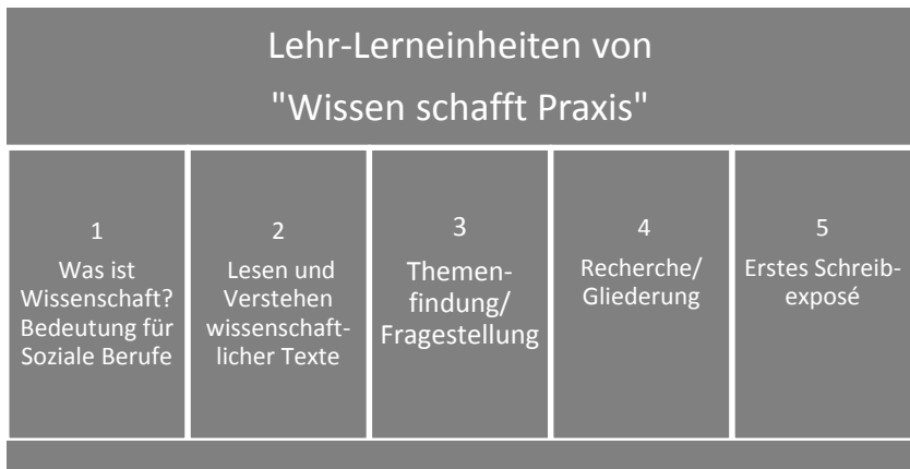
Abb. 2: Fünf Lehr-Lerneinheiten von „Wissen schafft Praxis“/Teil I 1. Semester.

Ablauf und Inhalte der Präsenz- und Online-Einheiten von Teil I waren in insgesamt fünf Lehr-Lerneinheiten in vier Präsenzwochen unterteilt, mit den Themen: Einführung, Lesen wissenschaftlicher Texte, Recherchieren, Themenfindung und Gliederung sowie erstes Schreibexposé.