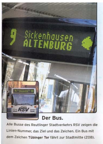
Abbildung 4: Gestaltung der Displays an Bus und Haltestelle

Dynamische Fahrgastinformationen über aktuelle Abfahrt von Bussen an Haltestellen sowie Anzeigen an den Bussen mit Liniennummer, Endhalt und Bildzeichen (STEIERWALD 2005, 711).