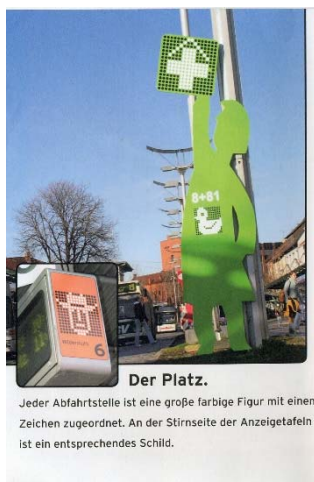
Abbildung 2: Signaturen der Haltestellen

Der Zentrale Omnibusbahnhofes stellt als verkehrliche Schnittstelle (Zielhalt und Umstieg) besonders hohe Anforderungen an Barrierefreiheit, Gestaltqualität. So sorgen hier raumbildende Elemente für schnelle Orientierung der Anordnung, Zugänglichkeit, Sichtbarkeit der Haltepositionen der Busse (vgl. STEIERWALD 2005, 549).