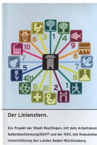
Abbildung 3: Liniestern als Grundmodell

Der Zentrale Omnibusbahnhofes stellt als verkehrliche Schnittstelle (Zielhalt und Umstieg) besonders hohe Anforderungen an Barrierefreiheit, Gestaltqualität. So sorgen hier raumbildende Elemente für schnelle Orientierung der Anordnung, Zugänglichkeit, Sichtbarkeit der Haltepositionen der Busse (vgl. STEIERWALD 2005, 549).