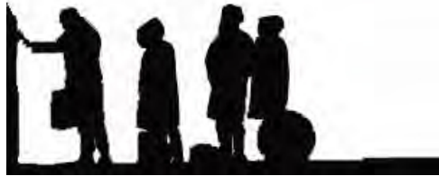
Abbildung 1/Vierter sein

Im nachfolgenden Text wird versucht, den didaktischen Ertrag von Reihe und Linearität darzustellen und in den größeren Zusammenhang der sog. Ordnungsformen zu stellen.