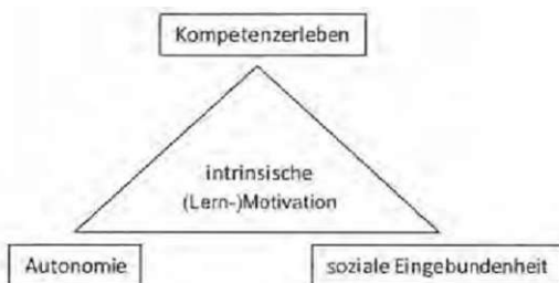
Abb. 1: Psychologische Bedürfnisse zur Ausprägung intrinsischer (Lern-)Motivation nach Deci/Ryan 1993

zur Erreichung bestimmter Ziele bzw. Grundmotive (vgl. McClelland 1967) auswählt und - nach neuem Verständnis - selbstregulativ steuert (vgl. Deci/Ryan 1993; Bandura 2004). Von Lernmotivation wird immer dann gesprochen, wenn es sich beim Verhalten des Individuums um eine Lernaktivität handelt. Unterschieden wird u.a. in personale (Motive) und situative (Anreize) Merkmale sowie in intrinsische und extrinsische Motivation (vgl. Barbuto/Scholl 1998): Während bei der intrinsischen Motivation der Anstoß zur Handlung von innen , also aus der Person selbst, erfolgt („intrinsic process“ oder „internal self concept“), werden Handlungen des Individuums bei extrinsischer Motivation mittels äußerer Anreize wie Anweisung, Belohnung oder Strafe initiiert („instrumental motivation“, „external self concept“ oder „goal internalization“, vgl. Barbuto/Scholl 1998). Da in Bezug auf Lernmotivation die Motivation, die aus der bzw. dem Lernenden selbst entsteht, als besonders erstrebenswert gilt, identifiziert die Selbstbestimmungstheorie von Edward Deci und Richard Ryan (1993) drei grundlegende psychologische Bedürfnisse, die als Voraussetzung zur Ausprägung intrinsischer Motivation angesehen werden: Kompetenzerleben, soziale Eingebundenheit und Autonomie bzw. Selbstbestimmung.'