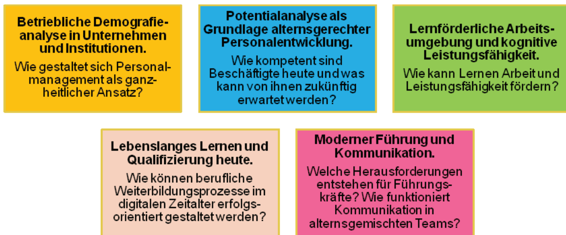
Abb. 1: Module der Qualifizierung „Demografiemanagement“ (eigene Darstellung)

gung zielgruppen- und generationsspezifischer Lernmotive. Auch Bildungstrends wie beispielweise das Lernen selbst zu regulieren, zielorientiert mit Informations- und Kommunikationstechnologien umzugehen sowie kooperativ und prozessorientiert zu lernen gilt es zu berücksichtigen (Arnold/Pachner 2011).