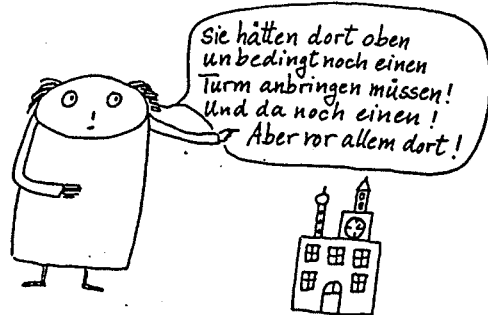
Abbildung 1 (GRELL 1979)

Den Erziehungsbehörden wird der Vorwurf gemacht, sie gäben keine Anhaltspunkte, so dass lediglich die Erfahrungen der jeweiligen Schulinspektoren und damit zu viele subjektive Aspekte berücksichtigt würden. Vielleicht können die Gesichtspunkte nicht offengelegt werden, weil allgemein anerkannte Kriterien für "guten" Unterricht fehlen. "Wir haben es in der Didaktik bisher nicht geschafft, für die Bewertung von Unterrichtseinheiten intersubjektiv eindeutig verfügbare Kriterien zu entwickeln, jedenfalls keine, die es ermöglichen, dass der kritisierende Mentor sich an Regeln halten muss, die von den Kritisierten überprüft werden könnten" (BLANKERTZ 1977; zitiert nach GRELL 1979,282). GRELL (1979,284) zeigt die Konzeptionslosigkeit vieler Besprechungen sehr anschaulich, wenn er von den "Sie-hätten-doch-auch-Argumenten" spricht, den "Türmchen-Effekt" (einem bestehenden Gebäude allerlei Verzierungen anbringen) benennt und dies so karikiert: