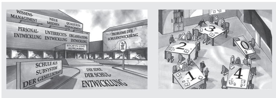
Abbildung. 1: Beispiele für die grafische Gestaltung der Lernumgebung