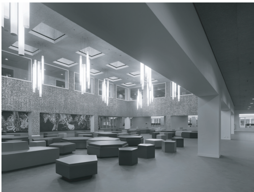
Abbildung 4: Luzern, UNI/PHZ-Gebäude, Foyer Erdgeschoss, mit Blick ins 1. Obergeschoss mit Bibliotheksbereich, Belichtung von oben über Lichthof

nutzerarbeitsplätze eine Erwähnung wert. Sie reicht von Gruppenarbeitsplätzen als «Lautbereichen» (social learning space) über Gruppenarbeitsräume bis hin zu ruhigen Bereichen, wie zum Beispiel dem grossen Lesesaal (vgl. dazu auch Schelling, in diesem Heft).