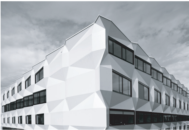
Abbildung 1: Luzern, UNI/PHZ-Gebäude, Fassadenausschnitt

Auffallend ist die Fassadentextur des neuen Gebäudes, die ihm – neben dem Bahnhofsgebäude und dem KKL – erst die ihm zustehende Präsenz verleiht. Die plastisch gestaltete Fassade bildet seine Signatur. Geschossweise alternierende und leicht abgedrehte Fensterflächen wollen diagonale Blickbeziehungen zum See und zur (Alt-)Stadt ermöglichen. Die Faltung ist eine Art Membrane, ähnlich einem gefalteten Papier, und wird so zur Metapher für das Innenleben (vgl. Abbildung 1). 3