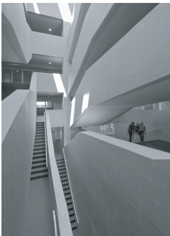
Abbildung 3: Luzern, UNI/PHZ-Gebäude, Treppenanlage

Beim Betreten des Gebäudes fällt die zentrale, doppelt geführte und sich nach oben verjüngende Treppenanlage als Herzstück auf (vgl. Abbildung 3). Bereits hier offen-