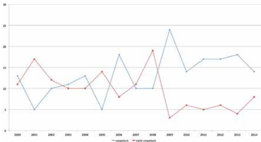
Abbildung 2: Schweizerische Zeitschrift für Bildungswissenschaften, Jahrgänge 2000-2014, nach wissenschaftlichem Zugang der Beiträge

Die Übersicht zeigt starke Anzeichen dafür, dass die mit der Neukonzeption der Zeitschrift angestrebten Veränderungen umgesetzt werden konnten. Die Zeitschrift ist wissenschaftlicher geworden und hat sich vermehrt international ausgerichtet. Aber sie kann inhaltliche Einseitigkeiten der wissenschaftlichen Produktion selbstverständlich nicht abfedern. Dass z. B. gewisse Stufen des Bildungssystems von der Forschung vernachlässigt wurden, zeigen auch die bis heute wiederholt vorgelegten Analysen, die im Beitrag Erwähnung finden.