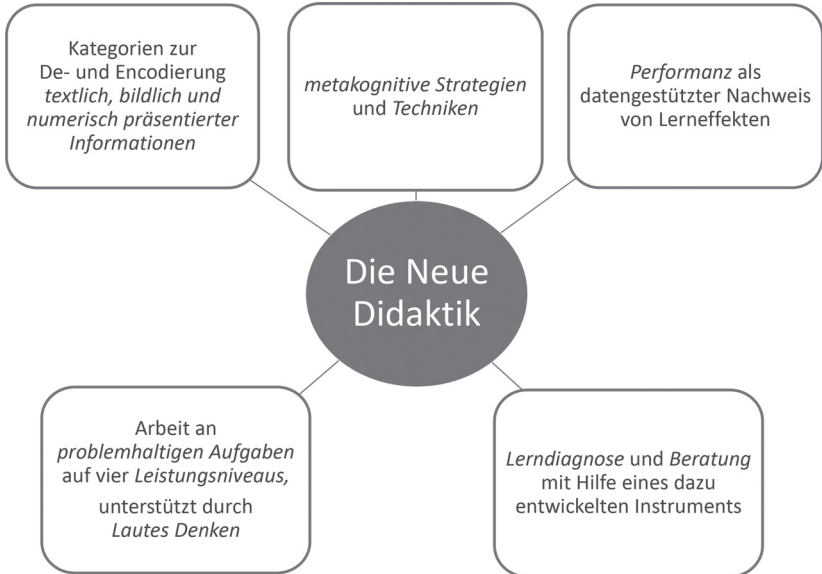
Abb. 1: Kernelemente der Neuen Didaktik

Im folgenden Strukturbild sind die Kernelemente festgehalten: