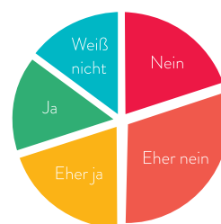
Eltern durch das Comité des parents