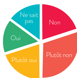
Élèves par les délégué(e)s de classe