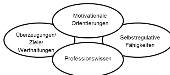
Abb. 1: Modell Professioneller Handlungskompetenz nach Baumert & Kunter (2006)

Die Frage nach der Professionalisierung der Pädagogischen Flüchtlingsarbeit wird folgend im Diskurs zur Pädagogischen Professionalität verortet. Es lassen sich hierzu zwei Hauptpositionen beschreiben. Einerseits sind auf Oevermann zurückgehende strukturtheoretische Positionen auszumachen; diesen ist der Fokus gemeinsam, dass sich Professionalität in der Fähigkeit des Umgangs mit Antinomien und dem Aushalten der strukturellen Unsicherheit im Lehrendenhandeln zeigt (Helsper, 2011). Andererseits ist kompetenztheoretischen Positionen der Ausgangspunkt gemeinsam, eine möglichst spezifische Beschreibung der Aufgaben von Lehrkräften vorzulegen. Basierend darauf ist es das Ziel, Kompetenzbereiche zu beschreiben, die für die Bewältigung der pädagogischen Aufgaben notwendig sind (Terhart, 2011, S. 207). Zur Frage nach der Topologie der professionellen Wissensdomänen dominiert in der Lehrendenforschung das von Baumert & Kunter (2006) vorgeschlagene Modell zur Professionellen Handlungskompetenz (vgl. Abbildung 1).