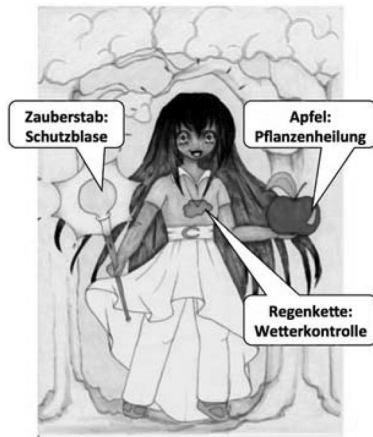
Abb. 5 Text von „Emre“ (3. Intervention)

Destruction Dani ist eine Superschurkin. Sie hat einen Fischgrätenzopf. In ihrer rechten Hand hält sie einen Blitz der für Stromausfall sorgt. In der linken Hand hält sie eine Spraydose, die dafür sorgt, Gebäude zu beschädigen. An ihrem linken Fuß ist ein Behälter mit einem Strohhalm. Im Behälter ist Kakao drin. Der Kakao liefert ihr große Kraft. Sie hat ein grünes Hemd. Um ihren Hals trägt sie eine Kette mit einem dunkelblauen „D“. Ihre kurze Hose ist dunkelblau, sowie ihre Stiefel.