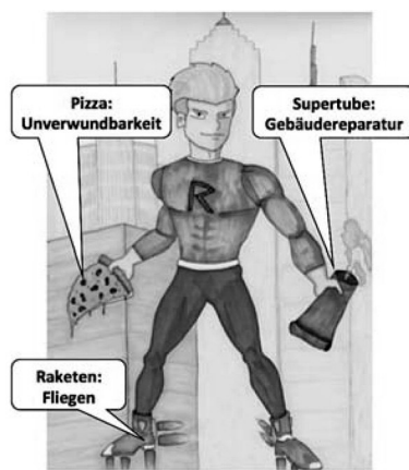
Abb. 1 Intervention 1: Bild, Textfelder, Aufgaben und Ausgangstext

Schritt 3: Schreibe jetzt eine gute Beschreibung von Rocket Rob. Vergiss nicht, dass dein Leser Rocket Rob nicht kennt. Mit deiner Beschreibung soll er sich Rocket Rob genau vorstellen können!