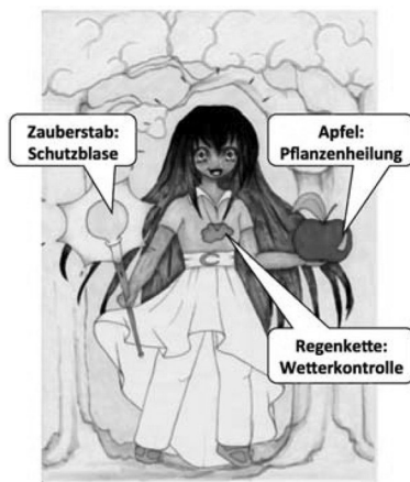
Abb. 5 Text von „Emre“ (3. Intervention)

Destruction Dani ist eine Superschurkin. Sie hat einen Fischgrätenzopf. In ihrer rechten Hand hält sie einen Blitz der für Stromausfall sorgt. In der linken Hand hält sie eine Spraydose, die dafür sorgt, Gebäude zu beschädigen. An ihrem linken Fuß ist ein Behälter mit einem Strohhalm. Im Behälter ist Kakao drin. Der Kakao liefert ihr große Kraft. Sie hat ein grünes Hemd. Um ihren Hals trägt sie eine Kette mit einem dunkelblauen „D“. Ihre kurze Hose ist dunkelblau, sowie ihre Stiefel.