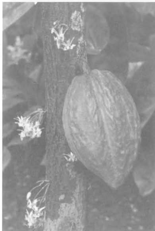
Kakao-Frucht am Baum

und die kleine Ernte zwischen Mai und August. Dicht am Stamm werden die Früchte mit einem Messer, der Machete, vorsichtig abgeschlagen. Für die Früchte, die an den oberen Zweigen hängen, benutzt man lange Stangen, an deren oberem Ende ein gebogenes Messer befestigt ist. Die Früchte werden in Körben gesammelt und an einem Platz auf einen Haufen gelegt. An diesem Sammelplatz werden sie