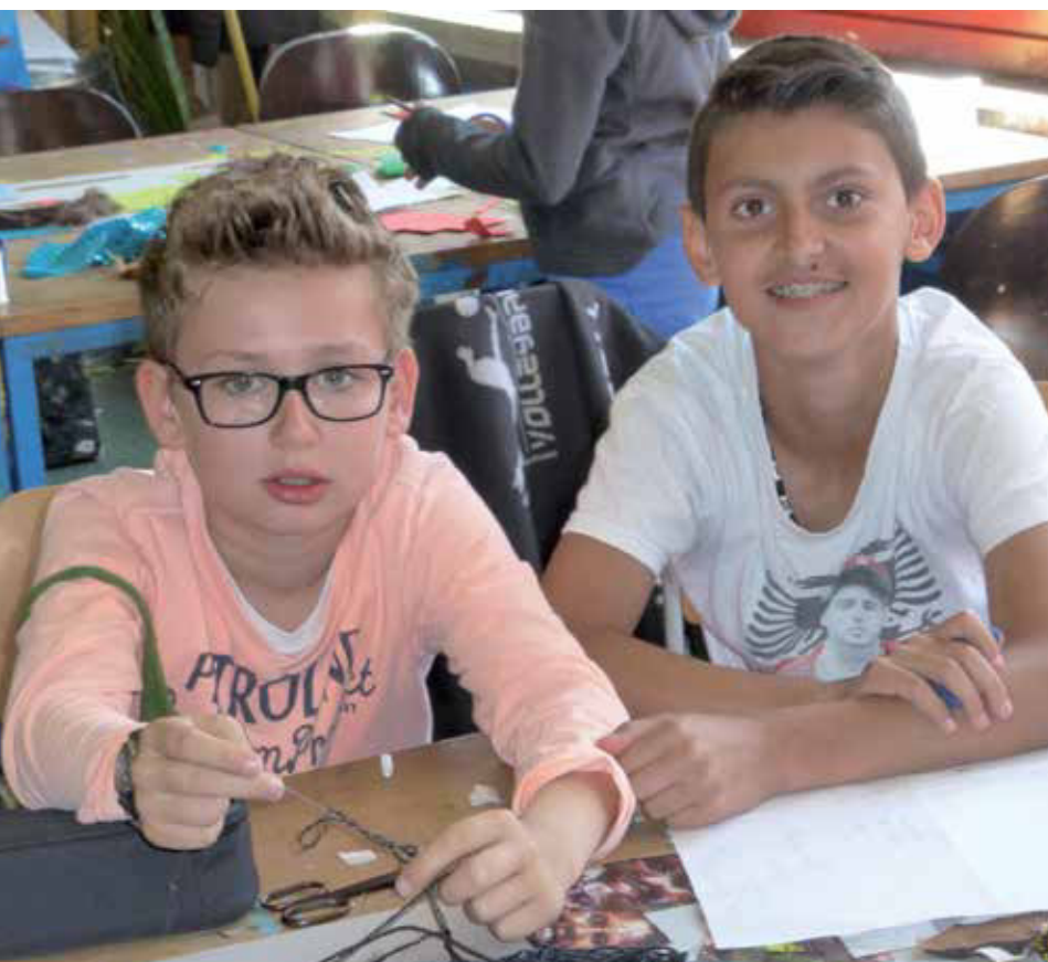
„Und...Action!“ – voller Einsatz für den Helden!

nationalen Kinder-Friedenspreis“ fand von April bis Juni 2016 in einer 5. Inklusionsklasse am Geschwister-Scholl-Gymnasium in Münster statt. Die Unterrichtsreihe „Global Heroes“ ist dort mit unterschiedlichen Schwerpunktsetzungen seit 2010 im Kunstunterricht verortet. Dafür sprechen folgende Erfahrungswerte: Das Fach ermöglicht Schülerinnen und Schülern, über einen längeren Zeitraum unter Anleitung eigeninitiativ und kreativ zu arbeiten, was in vielen anderen Unterrichtsfächern nicht mehr möglich ist. Davon profitieren alle, insbesondere die, die sonst eher zurückhaltend sind, Unterstützung benötigen, auffälliges Verhalten zeigen oder einfach „keinen Bock auf Schule haben“. Sie überraschen durch engagierte Mitarbeit, Interesse und hohe Motivation beim Ausführen der Arbeitsaufträge. Die versierte und engagierte Kunstlehrerin Stephanie Daume stand mir auch diesmal bei der Unterrichtsdurchführung mit Rat und Tat zur Seite. Unterstützt wurden wir durch eine Referendarin, Praktikantin und einen Schulbegleiter, sodass alle 22 Kinder gut ins Unterrichtsgeschehen einbezo- ►