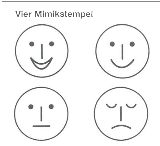
Abgestempelt – einsortiert Realsatire: Ein Verlag für pädagogisches Spielzeug ...

sozusagen zum Vorspiel für den eigentlichen Akt: den Klassenaufsatz.