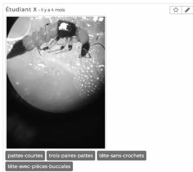
Figure 2. Exemple de production d'élève. La photographie a été prise à travers l'oculaire d'une loupe binoculaire avec une tablette tactile. Les mots-clés qui l'accompagnent correspondent aux caractères morphologiques identifiés par l'élève.