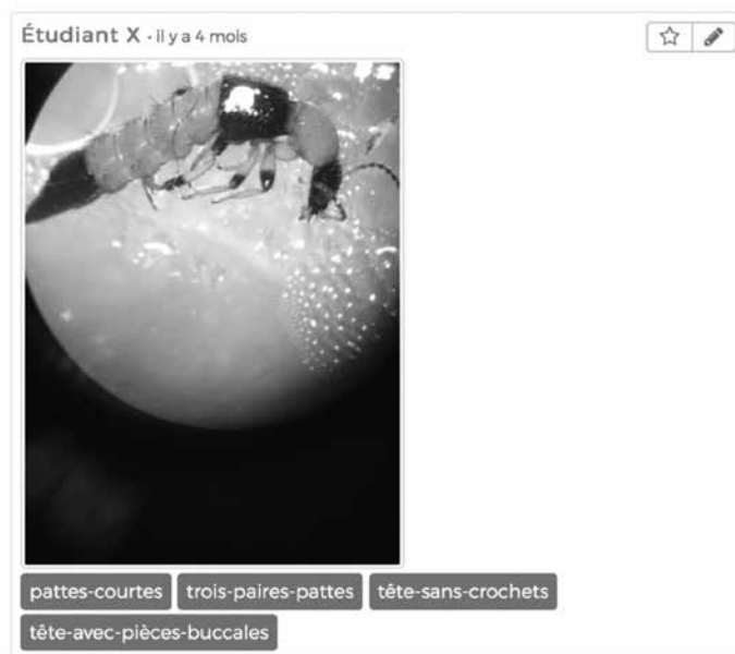
Figure 2. Exemple de production d'élève. La photographie a été prise à travers l'oculaire d'une loupe binoculaire avec une tablette tactile. Les mots-clés qui l'accompagnent correspondent aux caractères morphologiques identifiés par l'élève.