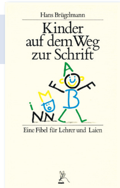
Titel der 3., »verbesserten und vor allem vergrößerten Auflage 1989«, Faude Verlag, Lengwil (CH)