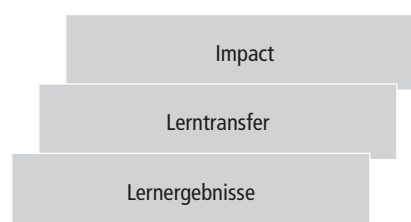
Abb. 1: Drei-Stufen-Modell der Wirkung von Weiterbildung

Die Autorin des vorliegenden Beitrages entwickelte 2015 ein darauf aufbauendes vereinfachtes Drei-Stufen-Modell der Wirkung von Weiterbildung (vgl. Petermandl 2015, S. 3-5).