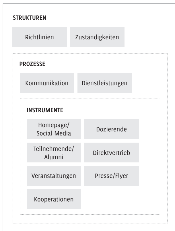
Abb. 2: Identifizierte Ebenen von Marketingaktivitäten in der wissenschaftlichen Weiterbildung.

Bei einer Systematisierung von empirischen Befunden zu marketingbezogenen Umsetzungsaktivitäten lassen sich drei zentrale Dimensionen – Instrumente, Prozesse und Strukturen – unterscheiden, die ebenen- und akteurspezifisch zugeordnet werden können. 7