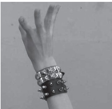
Abb. 1: Meldepraktik im Bild (Mohn & Amann 2006, 9)

Demnach scheint mit der Illustration eine implizierte Botschaft einherzugehen, die den Fall funktional an eine erste Interpretation bindet. Von Fällen in der Forschung, die der Illustration dienen, lässt sich aber auch dann sprechen, wenn ein Dokument dazu dient, nicht bloß implizit, sondern auch explizit einen thematisierten Zusammenhang, z.B. den Alltag Schuljugendlicher als Lernkörper und Schüler*innenensemble , zu zeigen und analytisch in den Blick zu bekommen, wie etwa bei Mohn und Amann (2006). An einer videografierten Sequenz können pädagogische Themen scharf gestellt werden und für Rezipient*innen kann etwas Bestimmtes auf besondere Weise sichtbar werden. Der Fall ist dann eine aufgezeichnete Beobachtung, z.B. die Meldepraktik einer Jugendlichen im Rahmen einer kamera-ethnografischen Forschung. Zur Verdeutlichung werden dazu von der Ethnograph*in auch Standfotos exzerpiert und publiziert: