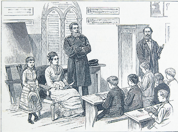
Schulprüfung in Dornstedt in Anwesenheit der kaiserlichen Familie.