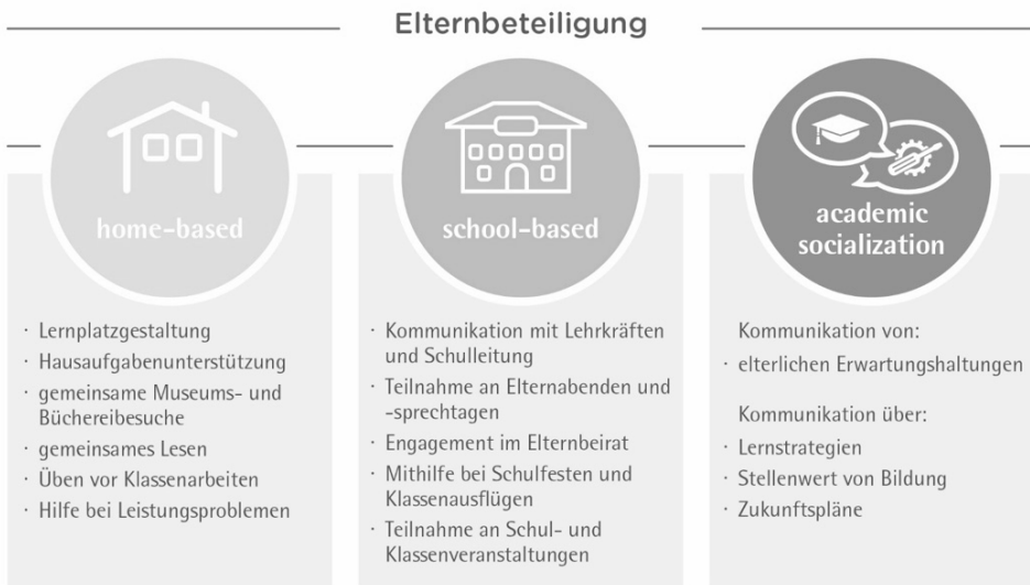
Abb. 1: Die drei Dimensionen der Elternbeteiligung nach Hill und Tyson (2009) mit beispielhafter Zuordnung von verschiedenen Formen der Elternbeteiligung