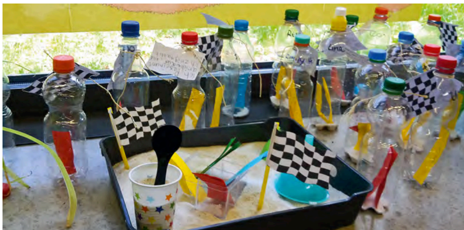
Beim Erreichen von Teilzielen wird jeweils Sand in die Flaschen gefüllt

Die Sammlung ist nicht vollständig im Sinne des LehrplanPlus Grundschule, jedoch stammt sie von den Kindern und die ganze Klasse weiß und versteht, was mit den einzelnen Zielen gemeint ist. ▶