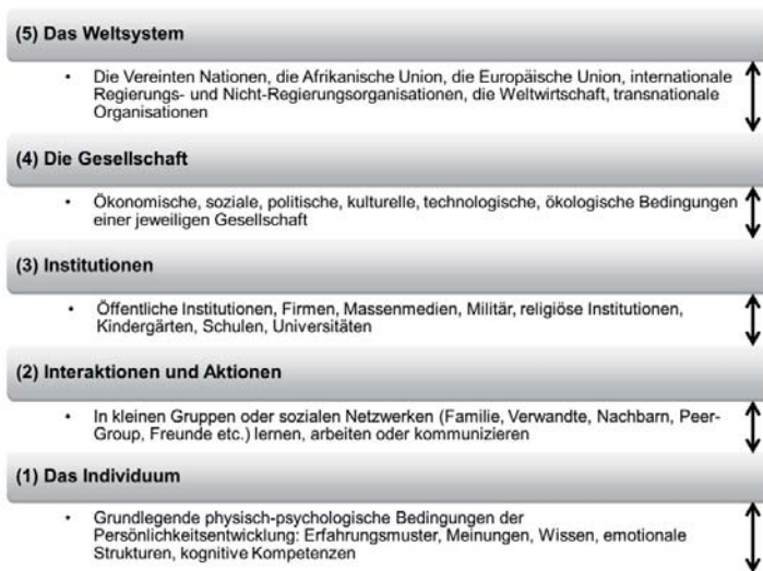
Abbildung 3: Das Strukturmodell der Sozialisationsbedingungen nach Nestvogel (1991, 2002) und Adick (1997)