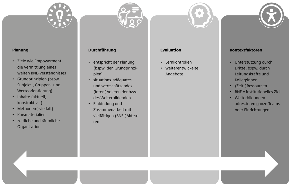
Abb. 2: Dynamisches Zusammenspiel unterschiedlicher Dimensionen und Gelingensbedingungen