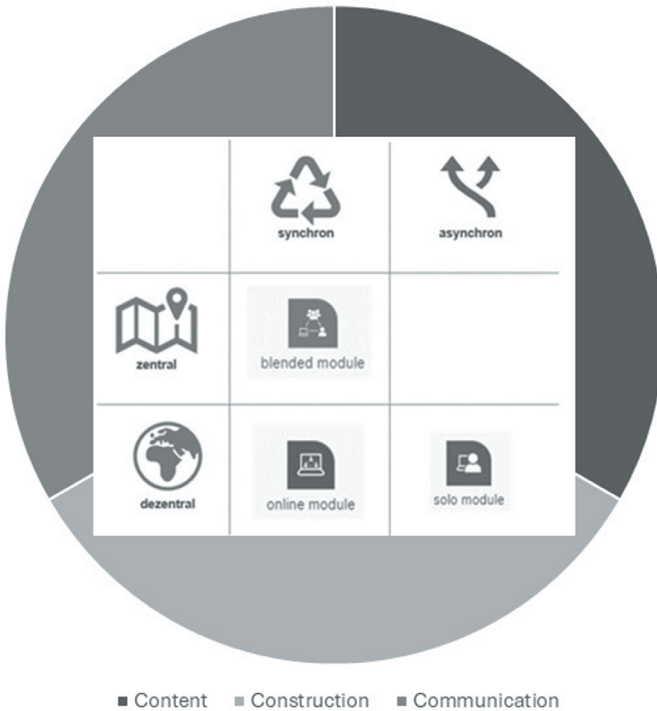
Abbildung 2: Grafische Darstellung der Modulformate und des 3C-Modells.

in unterschiedlichen Modul dauern zur Verfügung gestellt. Damit können Nutzende Module nicht nur nach inhaltlichen Kriterien oder Modulformaten auswählen, sondern auch nach dem zeitlichen Aufwand, der für das Modul erforderlich ist. Derzeit werden Module angeboten, die je eine Bearbeitungsdauer von einer bis vierundzwanzig Stunden aufweisen.