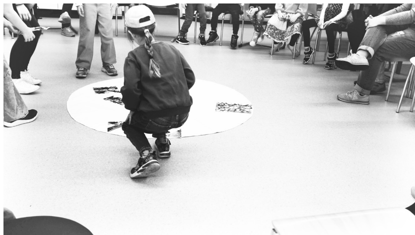
Abb. 6: Sitzkreis – Einführung in die Lernwerkstatt

Die Schüler*innen kommen zu uns an die Hochschule, werden begrüßt und in den Raum der Forschungswerkstatt (Nebenraum zur Lernwerkstatt) geführt, in dem sich ein Sitzkreis befindet (Abb. 6). Die Lernbegleiter*innen begrüßen sie und führen durch unterschiedliche Aktionen in das Thema ein. Durch ein Gedicht, eine Malgeschichte, ein Puzzle oder Materialien zum Fühlen finden sich die Lernenden ein.