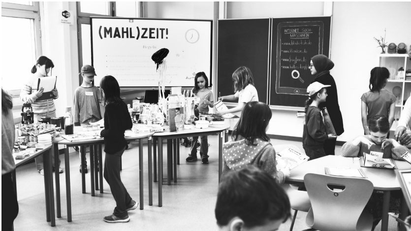
Abb. 7: Schüler*innen der Primarstufe in der Lernwerkstatt

Mit diesem Vorwissen dürfen die Schüler*innen in den Raum Lernwerkstatt Nawi gehen, in dem die Lernlandschaft aufgebaut ist. Zuerst wird nur geschaut und noch nichts angegriffen. Der Arbeitsauftrag ist, dass sie in das Forschungstagebuch notieren oder zeichnen, was sie sehen. Mit vielen Eindrücken kehren sie wieder in den Sitzkreis zurück und jede*r Schüler*in sagt eine Sache, keine sollte zwei Mal gesagt werden. Manchmal gibt es auch noch eine zweite und dritte Runde.