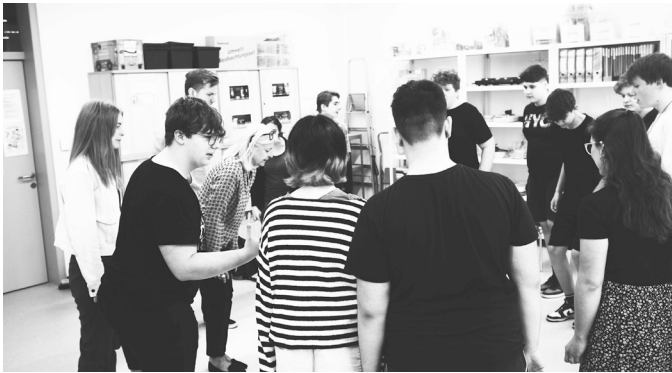
Abb. 10: Einstimmung mit einem Bewegungsspiel mit Schüler*innen der Sekundarstufe I

Auch dieser Tag beginnt mit einem Sitzkreis. Zur Einstimmung und zum Einfinden kann ein Bewegungsspiel oder Ähnliches gemacht werden (Abb. 10).