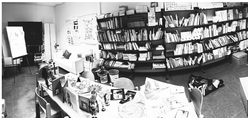
Abb. 3: Bild der Lernlandschaft Lebens(t)räume

Abbildung 4 zeigt eine Lernlandschaft, die für Schüler*innen gestaltet wurde. Das Thema war „Zeit und Veränderung“. Hier sieht man die Entwicklung des Frosches, einen vertrockneten Maiskolben, eine Uhr, Familienbilder, etc.