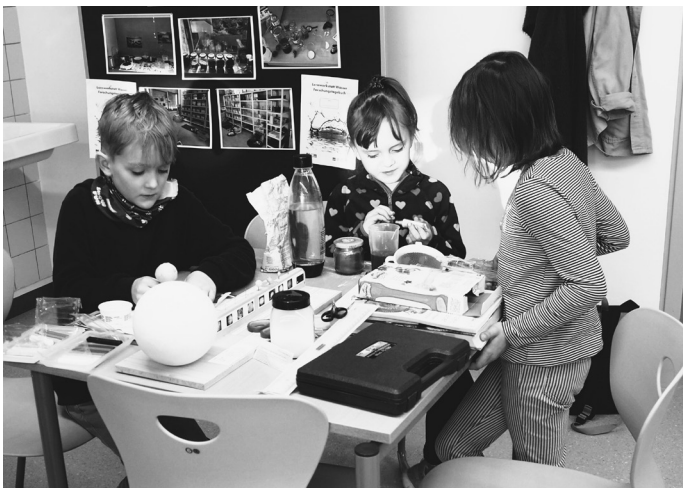
Abb. 1: Arbeiten in der Lernwerkstatt der PH Wien

Eingeführt wurde die Lernwerkstatt 2017 ursprünglich als Lernwerkstatt Nawi-Ma, also für Naturwissenschaften und Mathematik. Aufgrund von Platzmangel wurde entschieden, das zu trennen. So entstand die Lernwerkstatt Nawi und der eigene Raum mAThELIER (Holub 2018; Holub & Roszner 2021). Durch unterschiedliche Konzepte und Raumgestaltung wurden diese beiden Räume nicht mehr vereint und sind auch jetzt zwei unterschiedliche, anregende Lernräume für Studierende der Aus-, Fort- und Weiterbildung. Im Folgenden wird nur die Lernwerkstatt Nawi (Abb. 1) beschrieben, obwohl der Name etwas irreführend ist, denn Lernwerkstätten werden von uns vielperspektivisch gedacht.