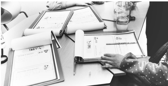
Abb. 9: Forschungstagebuch

Sobald die Forschungsfrage und die ersten Schritte hin zur Beantwortung der Frage mit der Lernbegleitung besprochen und fixiert sind, können die Schüler*innen starten. Ihren Arbeitsort dürfen die Schüler*innen frei wählen. Die Lernbegleiter*innen sind für alle Schüler*innen da, trotzdem wird ausgemacht, wer, welche Gruppe hauptsächlich betreut und im Blick hat, damit rasch und effektiv beraten werden kann, sollte es nötig sein. Die Lernbegleitung erinnert die Schüler*innen auch immer wieder daran, dass sie im Forschungstagebuch Aufzeichnungen machen sollen, damit sie später ihre Lernwerkstattarbeit gut nachvollziehen können (Abb. 9).