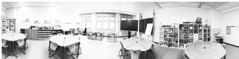
Abb. 2: Panoramafoto des Raumes Lernwerkstatt NAWI

Die Lernwerkstatt als Raum, mit seinen 70,45 m 2 , ist flexibel und freundlich gestaltet und für 30 Studierende konzipiert (Abb. 1). Sie lädt zum Verweilen, zum Schauen, zum Angreifen von Objekten ein. Deswegen wird sie auch sehr gerne für Seminare und Übungen genutzt. Die Objekte in den Regalen ziehen immer wieder die Blicke auf sich und lassen den Raum warm und einladend wirken. Die Lernwerkstatt Nawi wird aber auch, ihrem Namen gerecht, als Ort genutzt, um Lernwerkstätten durchzuführen.