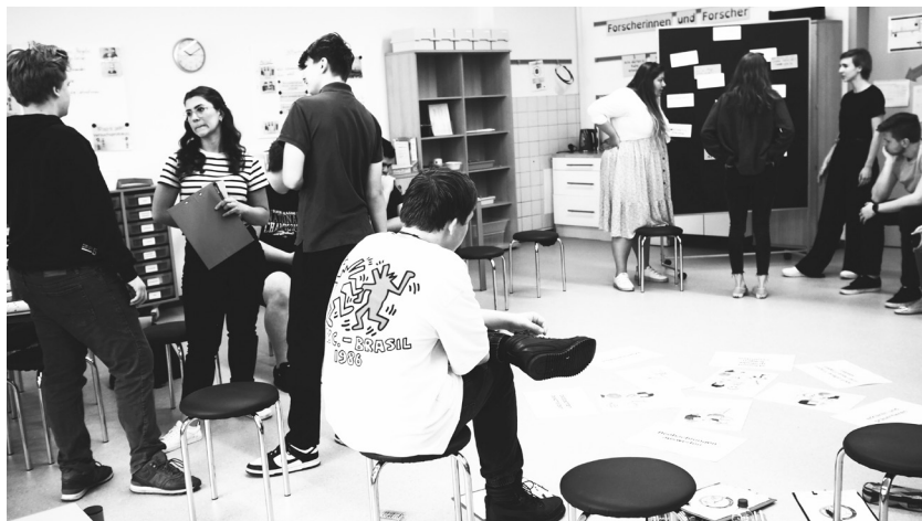
Abb.14: Konkretisierung der Fragestellungen in der von Studierenden geleitete Lernwerkstatt

Aus der Forschungsperspektive der Lernwerkstättenleiterinnen stellten wir die Forschungsfrage: „Wie gelingt der Transfer aus dem eigenen Lernen in der Lernwerkstatt in die Umsetzung der Lernwerkstatt mit den Schüler*innen innerhalb der Pädagogisch-praktischen Studien in inklusiven Settings?“ Hier hat sich der pädagogische Doppeldecker (Wahl 2006) als sehr lohnend erwiesen (Ovrutcki et al. 2023).