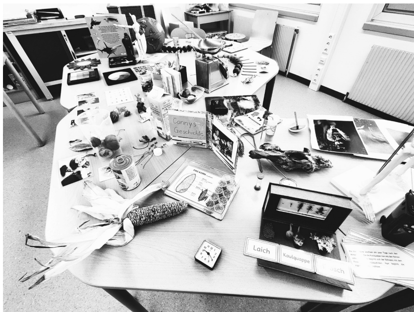
Abb. 4: Lernlandschaft zum Thema „Zeit und Veränderung“

Abbildung 4 zeigt eine Lernlandschaft, die für Schüler*innen gestaltet wurde. Das Thema war „Zeit und Veränderung“. Hier sieht man die Entwicklung des Frosches, einen vertrockneten Maiskolben, eine Uhr, Familienbilder, etc.