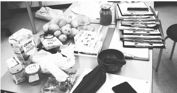
Abb. 11: Mitgebrachte Materialien und Forschungstagebücher

Nachdem die mitgebrachten oder vorbereiteten Dinge an die Gruppen verteilt wurden, wird weitergearbeitet (Abb. 11). Hier wird gebastelt, gemalt, recherchiert oder etwas aufgebaut (z. B. Stromkreis mit Kartoffel, Abb. 12).