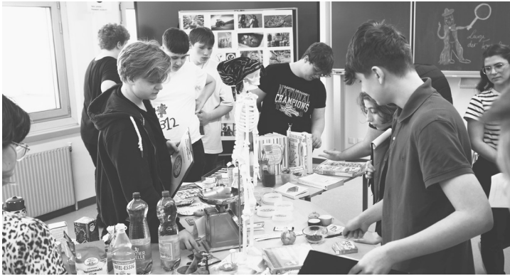
Abb. 8: Schüler*innen der Sekundarstufe bei der Lernlandschaft „Zeit“

Aus der Lernlandschaft „Zeit“ sind unterschiedliche Fragen entstanden, so zum Beispiel: „Wie funktioniert die alte Schreibmaschine?“, „Wie brechen Vulkane aus?“, „Wer war der erste Astronaut auf dem Mond?“, „Welches ist das älteste Buch der Welt?“, „Wie können Seesterne gehen?“, „Wie ist die Sprache entstanden?“, oder „Welche Uhren gibt es?“