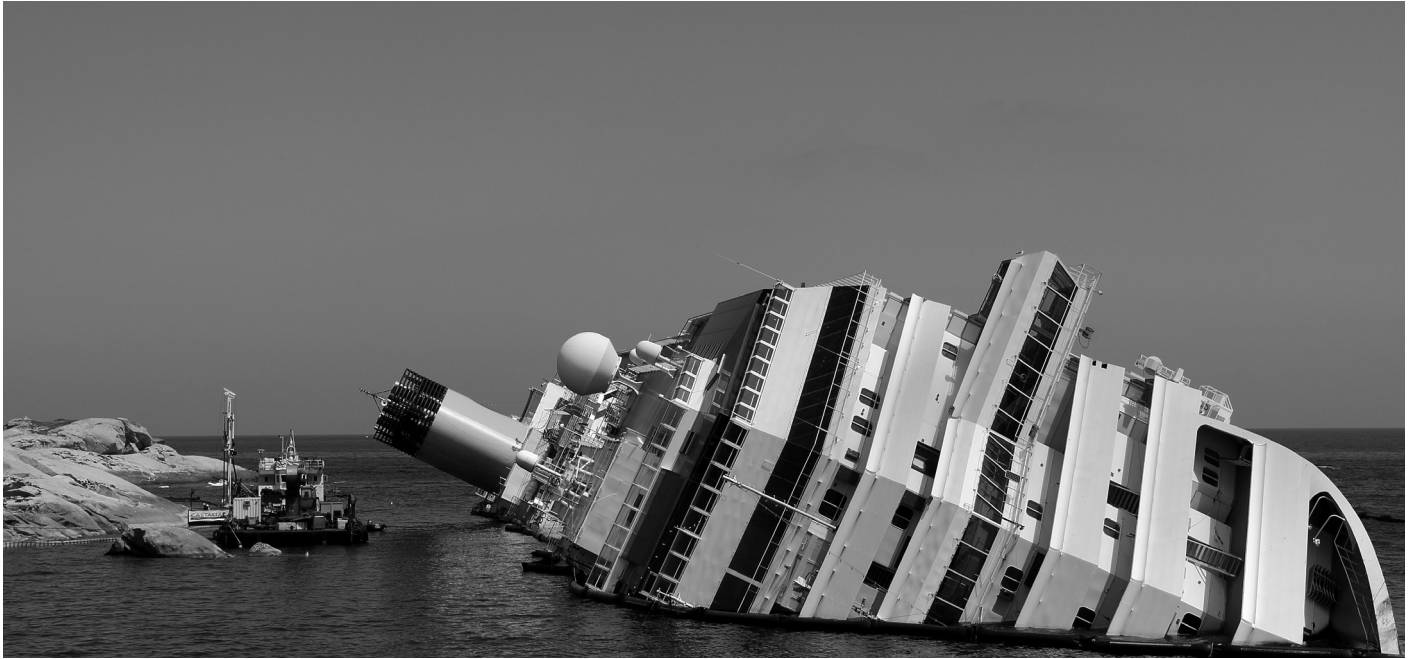
Schiffbruch vor Giglio 2012

gen, weil es hier um persönlich wichtige Erfahrungen, Prägungen und Einstellungen geht. Doch wenn Fragen zur religiösen Entwicklung, zu religiösen Erlebnissen oder spirituellen Techniken mit der Kirche gar nicht mehr in Verbindung gebracht werden, dann erledigt sie sich von selbst.