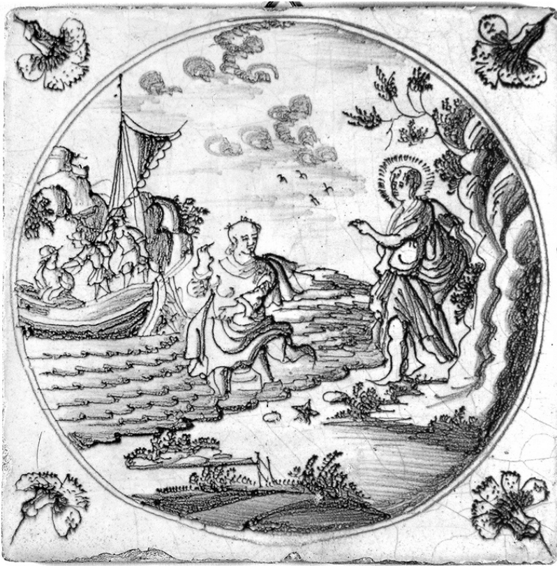
N211: Petrus wadet durch das Wasser zu Jesus, Johannes 21, 7

halts. Dass die Weihnachtserzählung eine Legende, die Trinität ein Symbol und die Schöpfungserzählung ein Mythos ist, wird nicht ausdrücklich benannt. Doch bei echter Frömmigkeit handelt es sich keineswegs um ein wörtliches Verstehen. Dennoch lässt man in den Gottesdiensten das uralte Glaubensbekenntnis nachsprechen, nach dem Jesus in die Hölle nieder- und in den Himmel aufgefahren ist: Die alte mythische Dreistockwerkewelt scheint einfach weiter zu bestehen. Auferstehung als Symbol? – Diesem Gedanken möchte man sich am besten nicht weiter stellen. So aber stärkt man in der Kirche die evangelikal-fundamentalistischen und autoritätshörigen Tendenzen und erweckt in der Außenwahrnehmung den Eindruck, das ganze Christentum sei dem Inhalt nach ein überholtes Märchen, der sozialen Struktur nach eine Sekte.