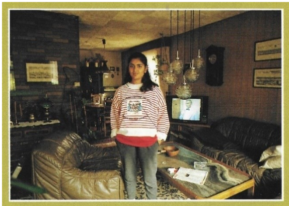
Abb. 1: Kwiran/Röller, 1989, 141.

Im drei Jahre später erschienenen Schulbuch Glauben und Leben aus dem Schroedel Verlag wird das Kapitel „Muslime – Christen“ mit dem Foto eines BIPOC-Mädchens abgebildet, das in ihrem Wohnzimmer steht (Kwiran/Röller, 1989, 141).