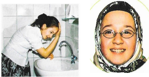
Abb. 4a und 4b: Bürig-Heinze/Fath/ Goltz et al. 2020, 159.

Nurdan stellt sich mit Namen, Alter und Religionszugehörigkeit vor. Dann erläutert sie religionskundliche Grundlagen ihrer Religion. Weitere Details ihres individuellen Lebens sind nicht im Text, sondern auf den Fotos zu finden.