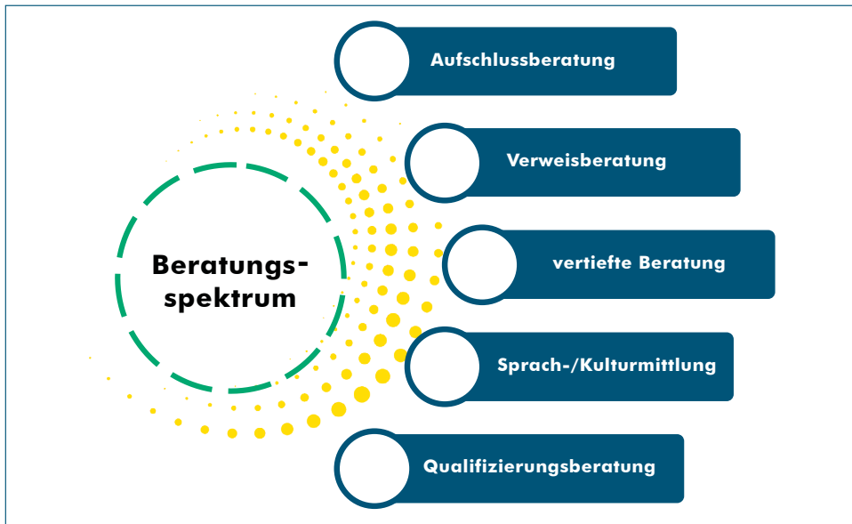
Abbildung 2: Beratungsarten bei bea-Brandenburg

Die Aufschlussberatung bildet den Einstieg durch Information, Sensibilisierung und erste Begleitung. Im direkten Gespräch werden betriebliche Bedarfe ermittelt, Vertrauen aufgebaut und erste Impulse gesetzt. Quick Checks und themenspezifische Fragebögen ermöglichen eine erste Einschätzung der betrieblichen Situation. Zusätzlich zeigt bea-Brandenburg auf regionalen Veranstaltungen und Messen Präsenz, um Aufmerksamkeit für relevante Themen zu schaffen und den Zugang zur Zielgruppe zu erleichtern.