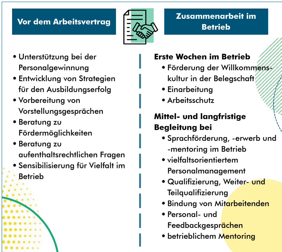
Abbildung 3: Beispielhaftes Portfolio der bea-Brandenburg im Verlauf der betrieblichen Integration

Gerade in Zeiten des Fachkräftemangels ist dies für viele Unternehmen von hoher Bedeutung. Denn mit der Investition in Integration in das Unternehmen geht oft auch die Sorge einher, dass eingearbeitete Mitarbeitende den Betrieb wieder verlassen. bea-Brandenburg begegnet dieser Sorge mit einem praxisnahen, stabilisierenden Beratungsansatz, der auf Vertrauen, Verlässlichkeit und passgenaue Lösungen setzt.