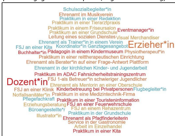
Abbildung 2: Angaben der Tätigkeiten vor dem Studium (sprachlich geglättete Stichprobe; eigene Darstellung)